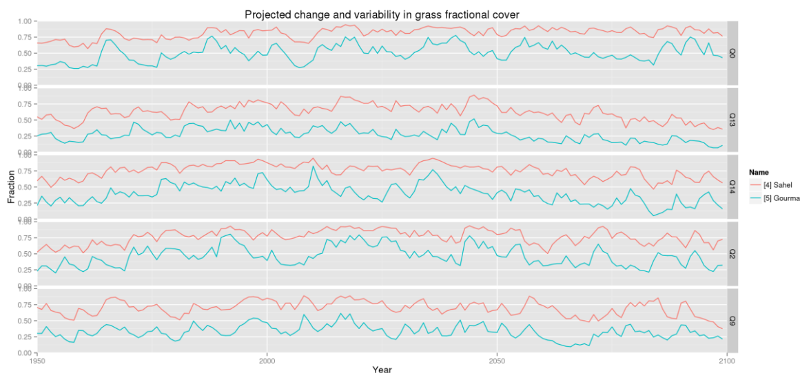
Figure 2. Série chronologique de la variabilité prévue de la couverture herbeuse et la variation pour la Réserve Partielle des Eléphants du Gourma et la réserve partielle du Sahel, qui constituent le site pilote transfrontalier du PARCC entre le Mali et le Burkina Faso. Les projections sont présentées pour chaque membre de l'ensemble, indiquant une forte adéquation entre les hauts niveaux de variabilité interannuelle continue.